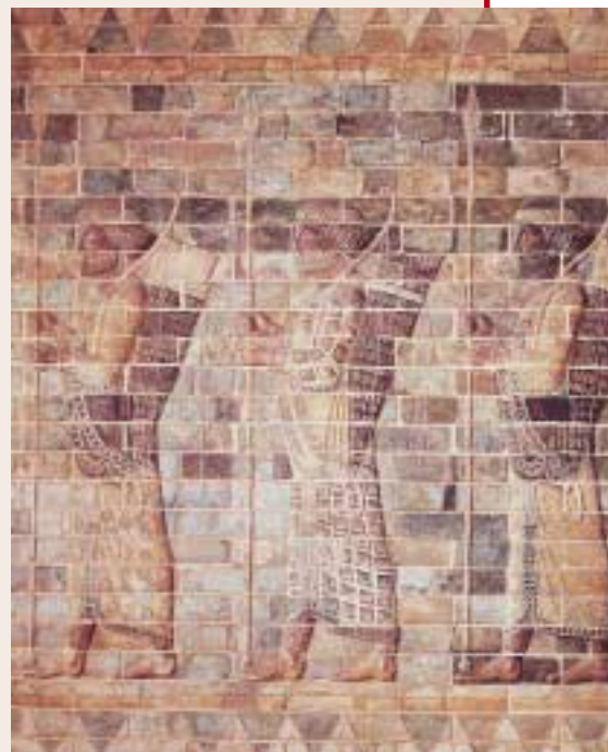
A fianco, un archiere in calzoni raffigurato in una coppa da vino del VI secolo a.C. (Parigi, Museo del Louvre). Sopra, tre "Immortali", le guardie del Re dei Re con il caffettano da cerimonia che copre i calzoni (Parigi, Museo del Louvre, pannello in mattoni dipinti invetriati dal palazzo di Susa).