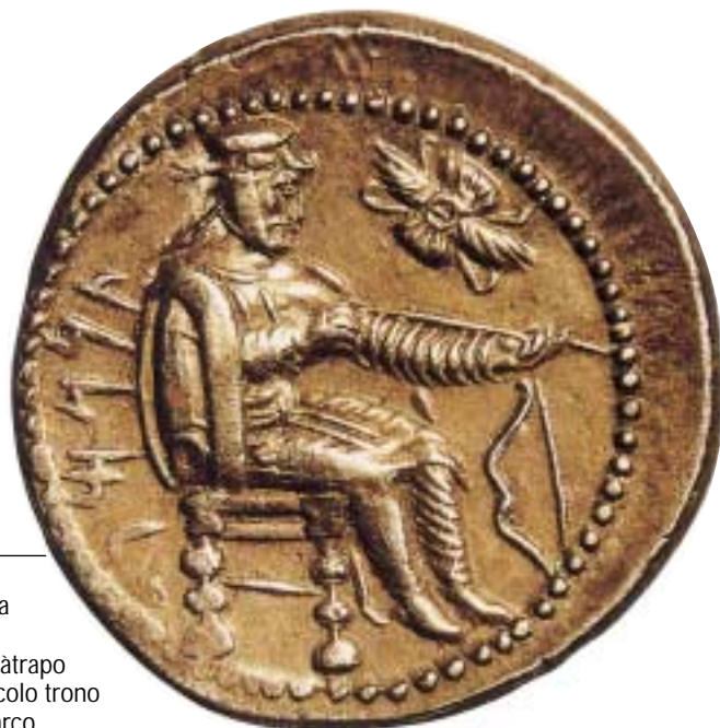
IL SÀTRAPO. Su questa moneta del IV sec. a.C. è raffigurato un sàtrapo seduto su un piccolo trono con in mano un arco.